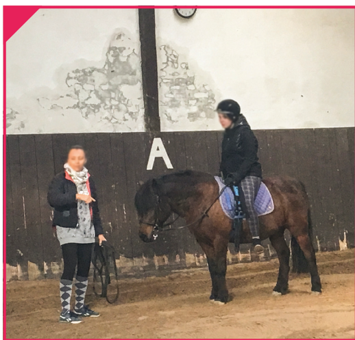
Pomoc psychologiczno-pedagogiczna - hipoterapia II