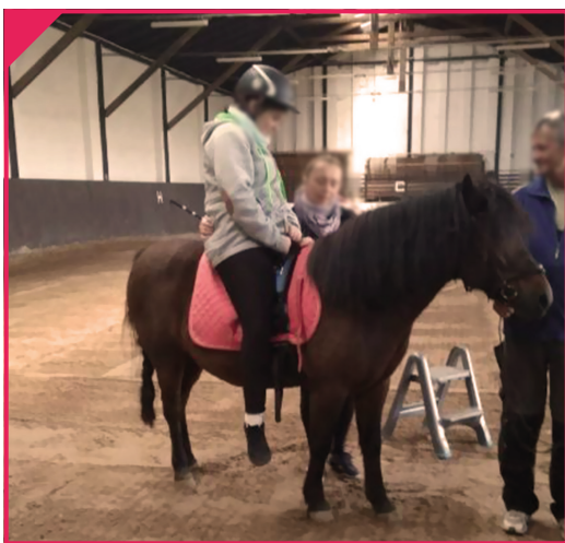
Pomoc psychologiczno-pedagogiczna - hipoterapia I

Wychodząc naprzeciw potrzebom uczniów oddziałów specjalnych przygotowaliśmy bogatą ofertę zajęć rewalidacyjnych, mających na celu wspieranie ich wszechstronnego rozwoju. wśród proponowanych form zajęć rewalidacyjnych znaleźć można: