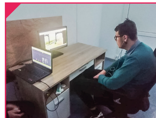
Terapia EEG biofeedback

terapii sensorycznej i rehabilitacji. Zajęcia te pozwolą na realizację podstawy programowej i służyć będą usprawnieniu ruchowemu uczniów autystycznych, którzy mają szereg deficytów związanych z brakiem aktywności fizycznej oraz otyłości somatycznej.